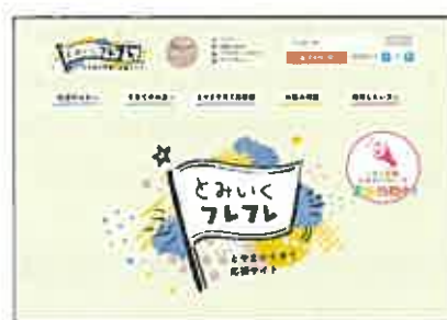
③ 「とみいくフレフレ病児保育施設」