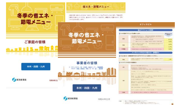
冬季の省エネ・節電メニュー