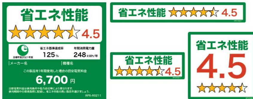
(冷蔵庫のイメージ)