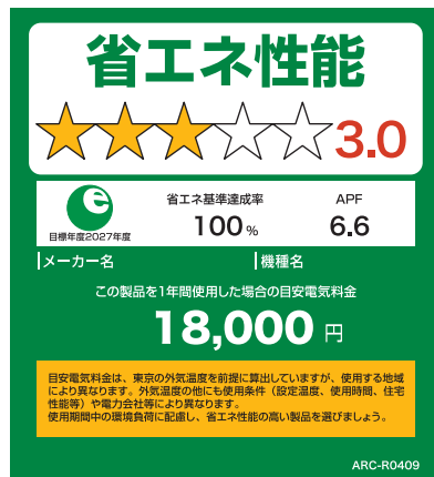
(家庭用エアコンディショナーのイメージ)