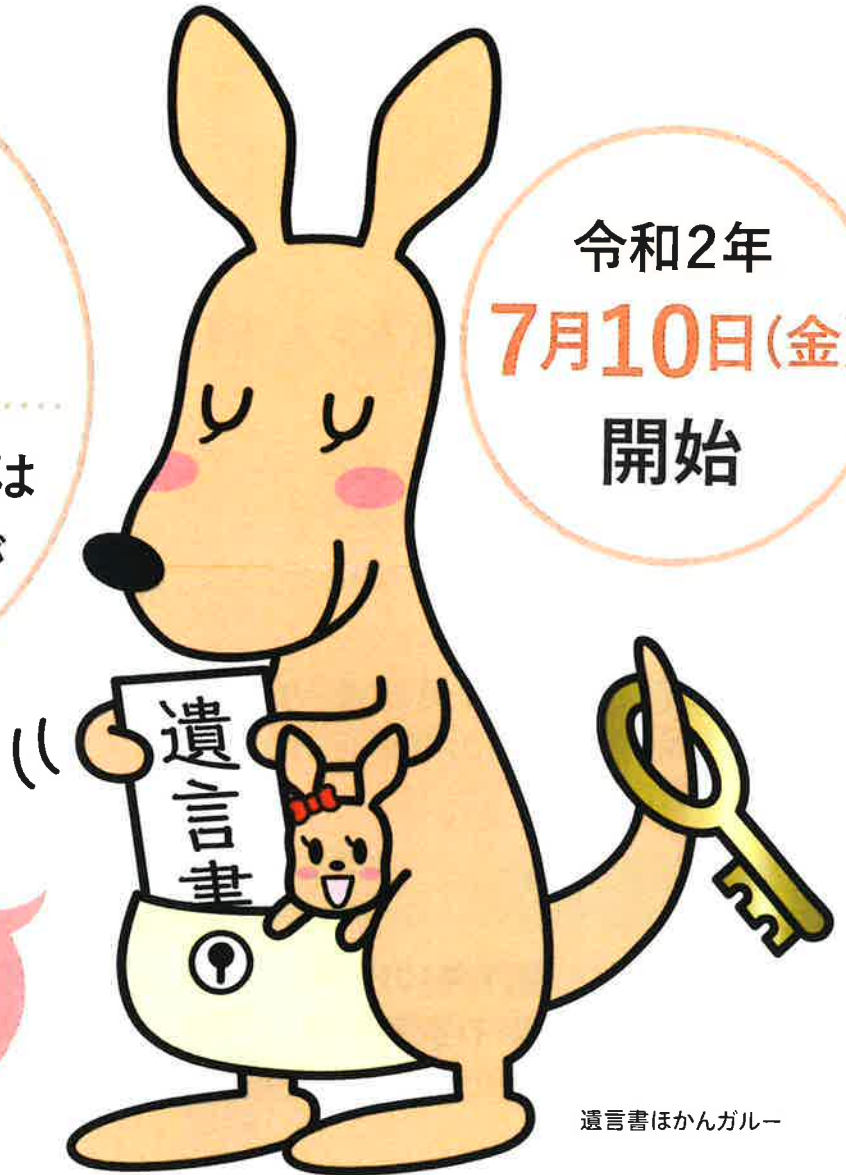
遺言書ほかんガルー