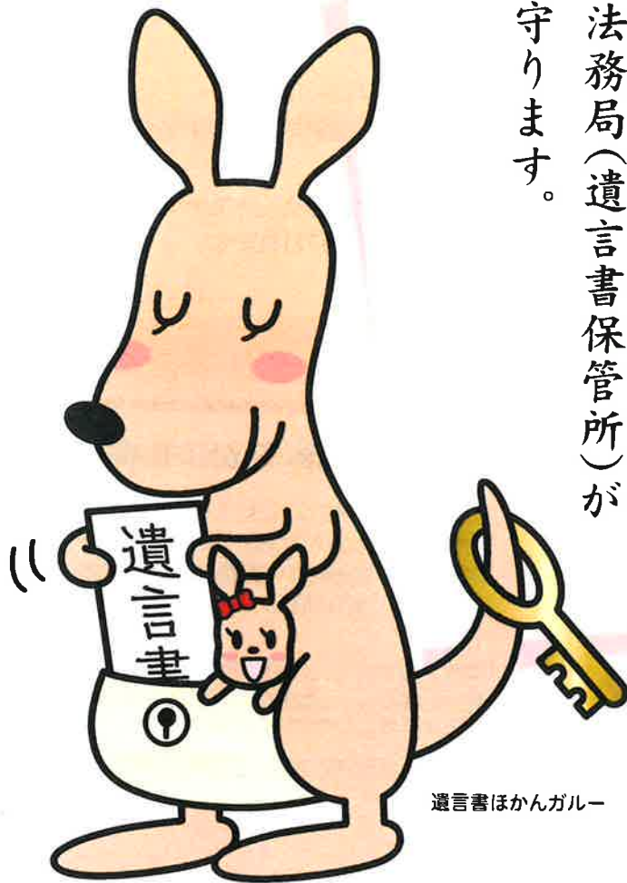
遺言書ほかんガルー